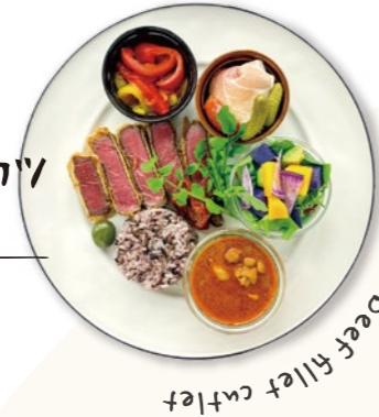
Beef fillet cutlet