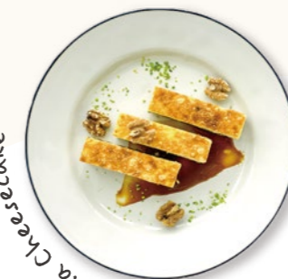
Salt & Banana Cheesecake