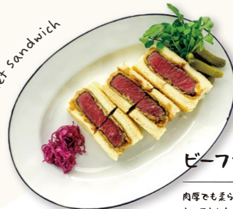
Beef cutlet sandwich